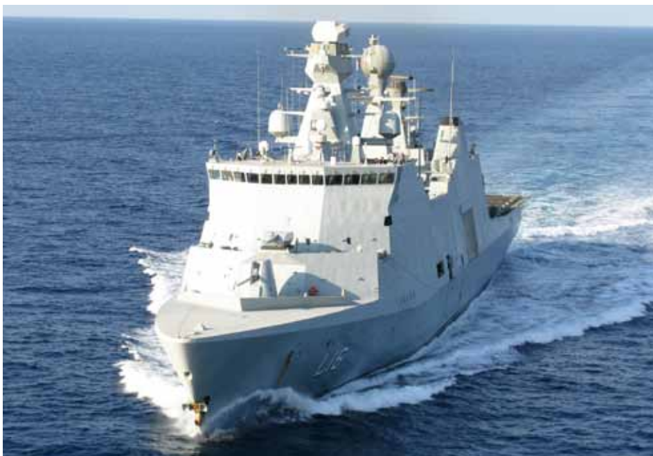
Det danske skib Absalon.

nem resolutionerne 1851 (2008), 1897 (2009), 1950 (2010) og 1976 (2011) sat rammerne for de internationale bestræ-